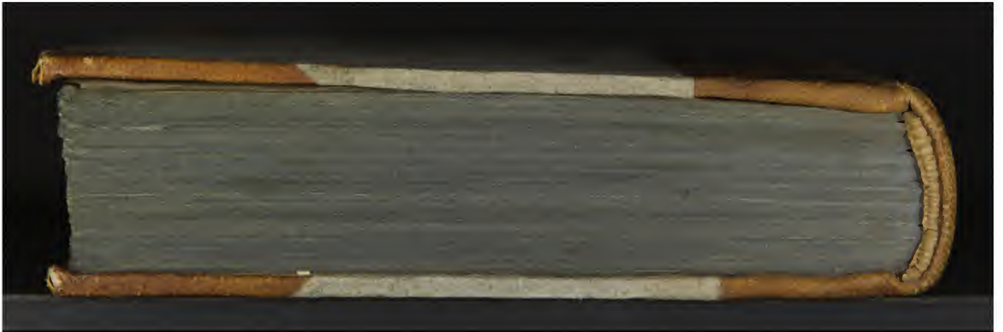
Magl. A.7.6